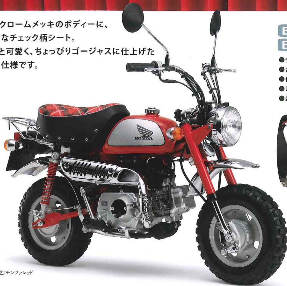
車体色:モンツアレッド

赤とクロームメッキのボディーに、 上品なチェック柄シート。 もっと可愛く、ちょっぴりゴージャスに仕上げた 特別仕様です。